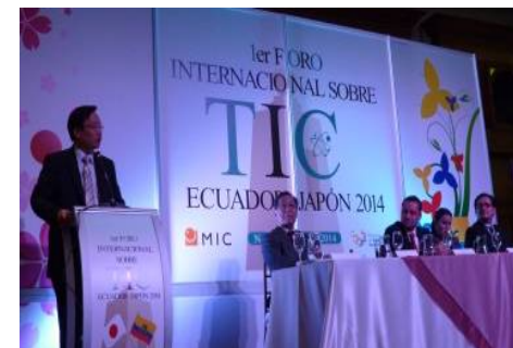
(第1回日・エクアドルICT政策対話)