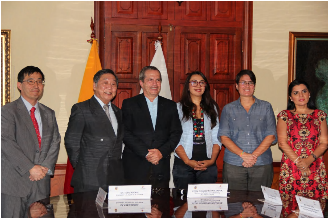
（左より，古屋 JICA エクアドル支所長，小瀧大使，パティニーニョ外相，パソス国家口頭教育・科学・技術・革新庁長官代理，バンセ保健大臣，タピア環境大臣）